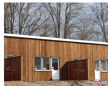
Radhusen i Risma där Pernilla Bertilsson är en av de nya hyresgästerna.