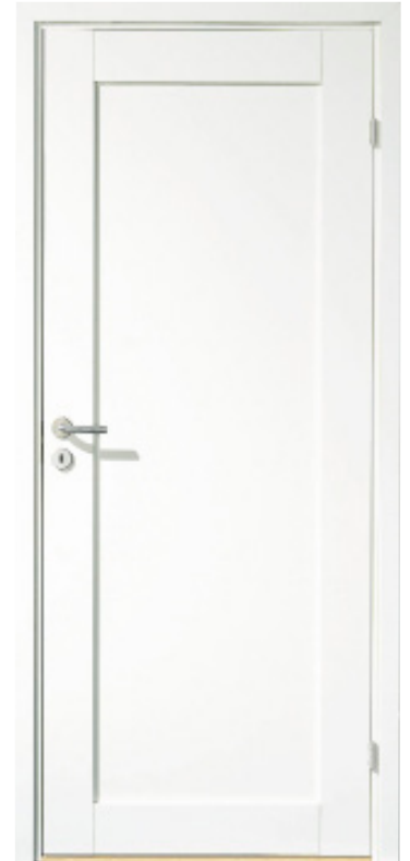
Bildet viser en av flere Adderadører. Flere modeller som illustrasjoner på neste side.