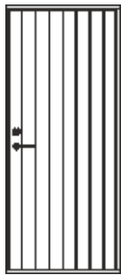
Bod 4110 18 grader