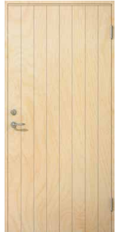
Bildet viser Bod 4210. Flere modeller som illustrasjoner på neste side.